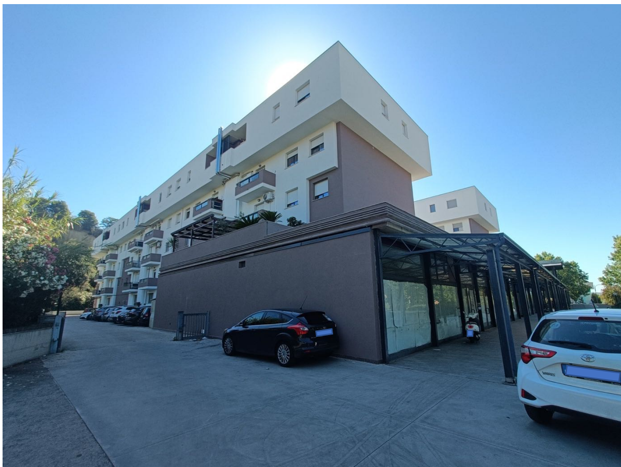
Fabbricato sito in Pescara alla Via di Sotto nn.10-12-14-16-18-20 insistente su terreno distinto al Foglio n.11 Particella n.1936