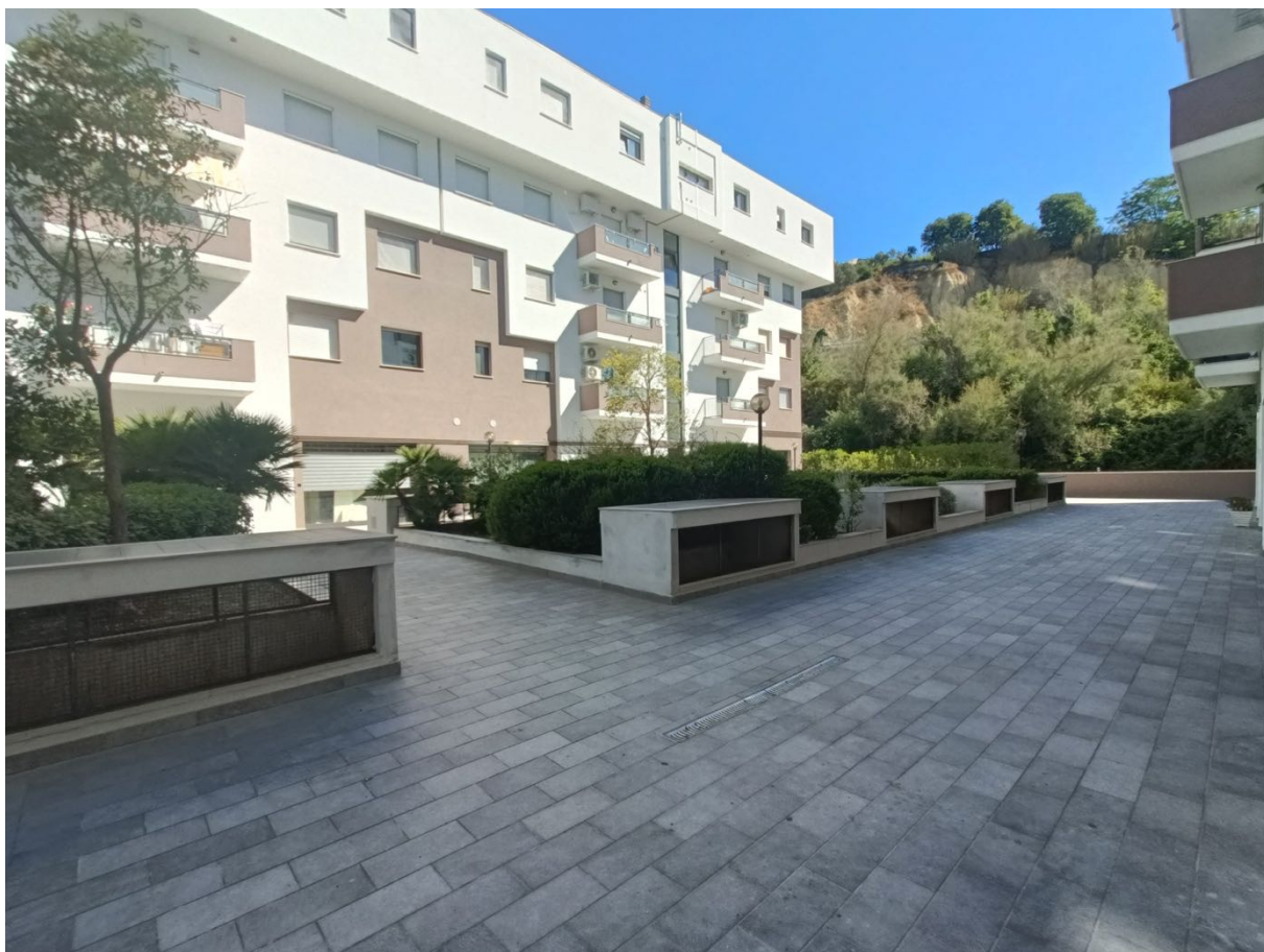
Fabbricato sito in Pescara alla Via di Sotto nn.10-12-14-16-18-20 insistente su terreno distinto al Foglio n.11 Particella n.1936