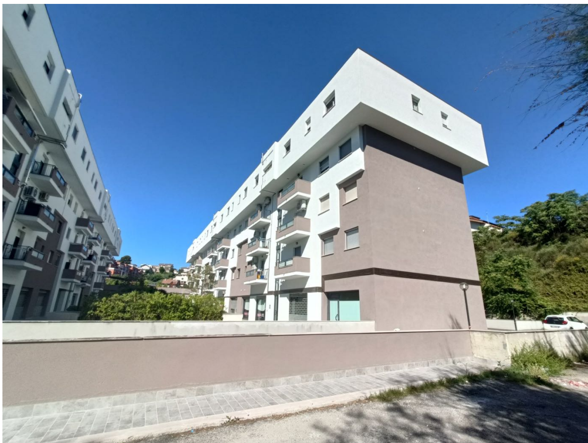
Fabbricato sito in Pescara alla Via di Sotto nn.10-12-14-16-18-20 insistente su terreno distinto al Foglio n.11 Particella n.1936