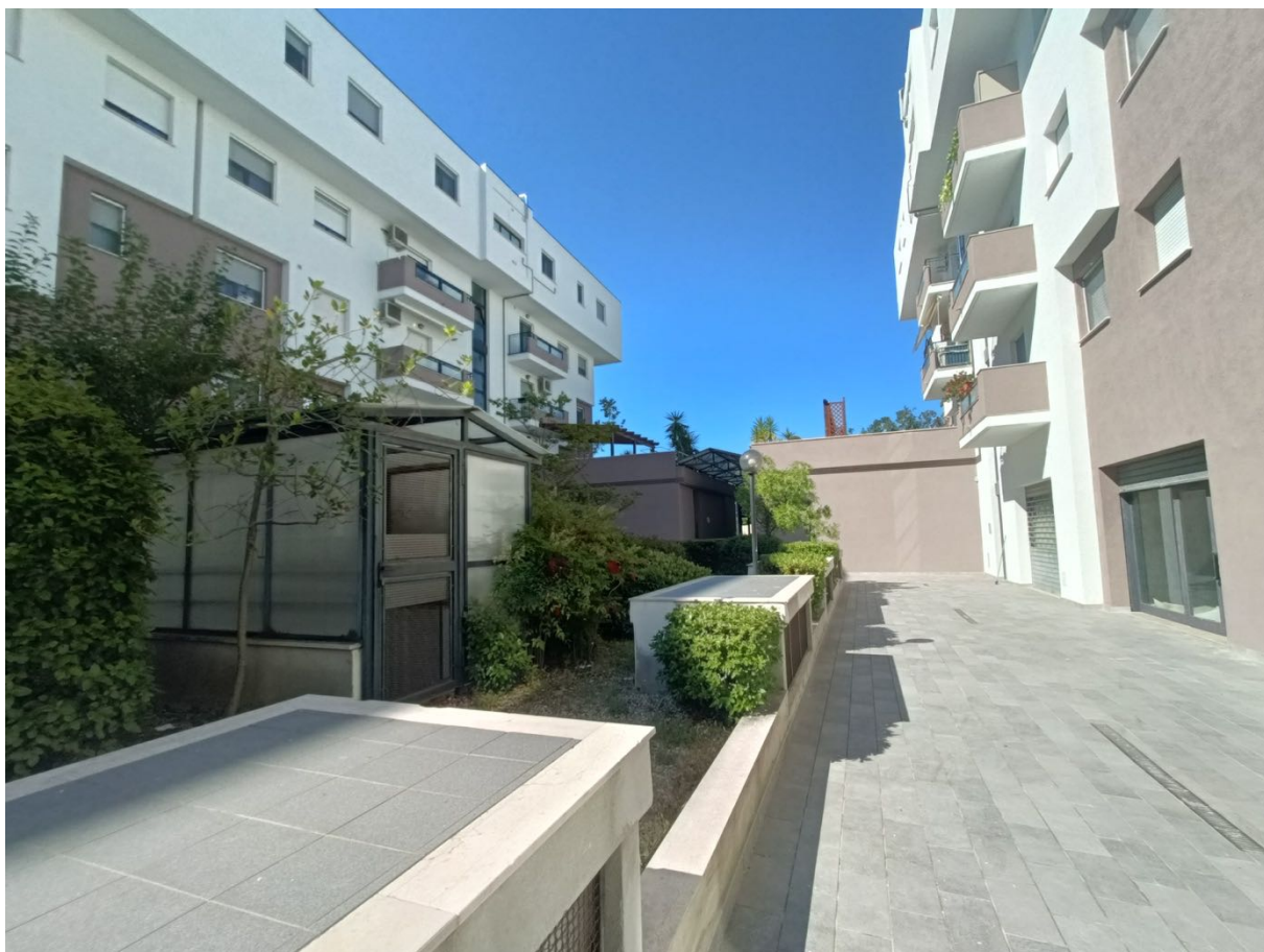
Fabbricato sito in Pescara alla Via di Sotto nn.10-12-14-16-18-20 insistente su terreno distinto al Foglio n.11 Particella n.1936