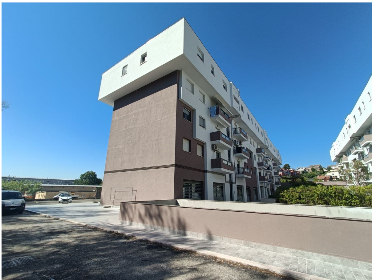
Fabbricato sito in Pescara alla Via di Sotto nn.10-12-14-16-18-20 insistente su terreno distinto al Foglio n.11 Particella n.1936