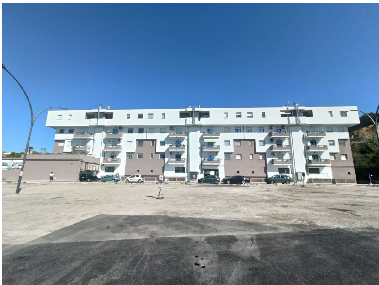
Fabbricato sito in Pescara alla Via di Sotto nn.10-12-14-16-18-20 insistente su terreno distinto al Foglio n.11 Particella n.1936