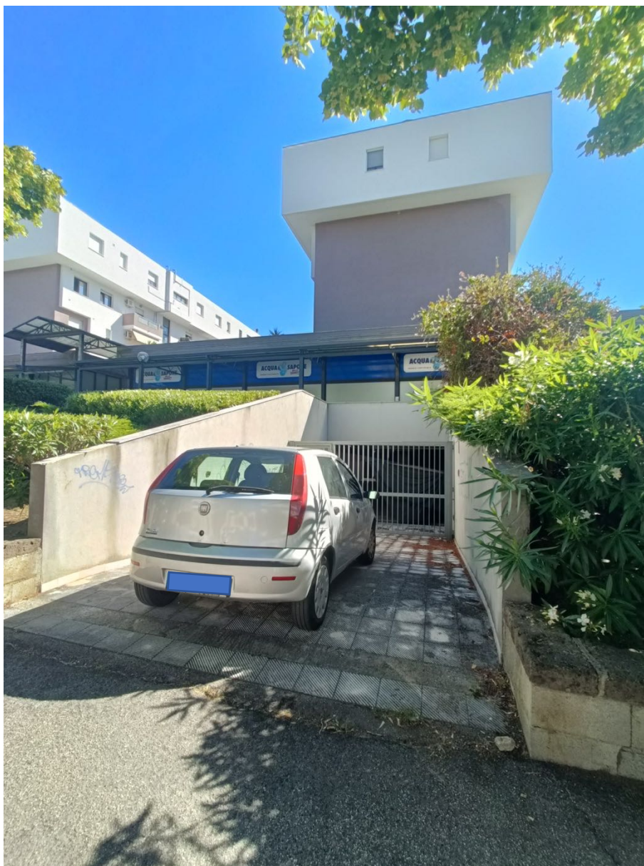
Fabbricato sito in Pescara alla Via di Sotto nn.10-12-14-16-18-20 insistente su terreno distinto al Foglio n.11 Particella n.1936