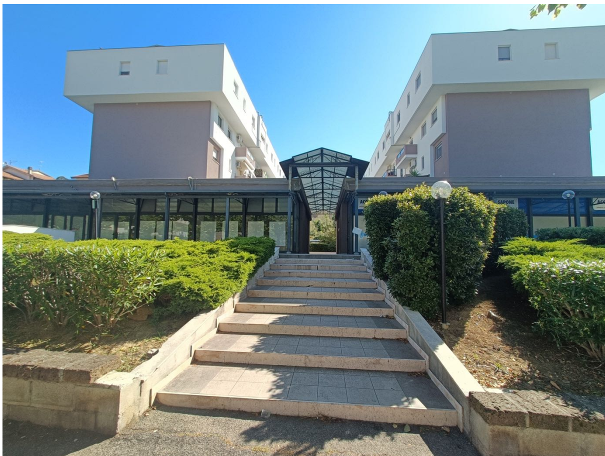
Fabbricato sito in Pescara alla Via di Sotto nn.10-12-14-16-18-20 insistente su terreno distinto al Foglio n.11 Particella n.1936