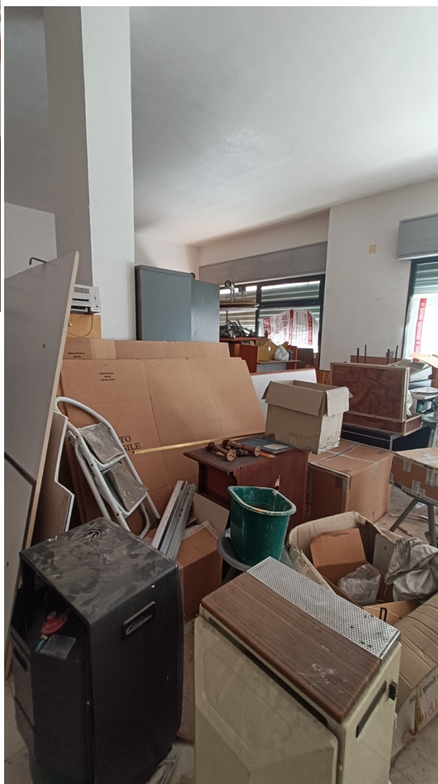
Negozio sito in Pescara alla Via di Sotto n.18, Piano terra, Scala B distinto al Foglio n.11 Particella n.1936 Sub. n.13