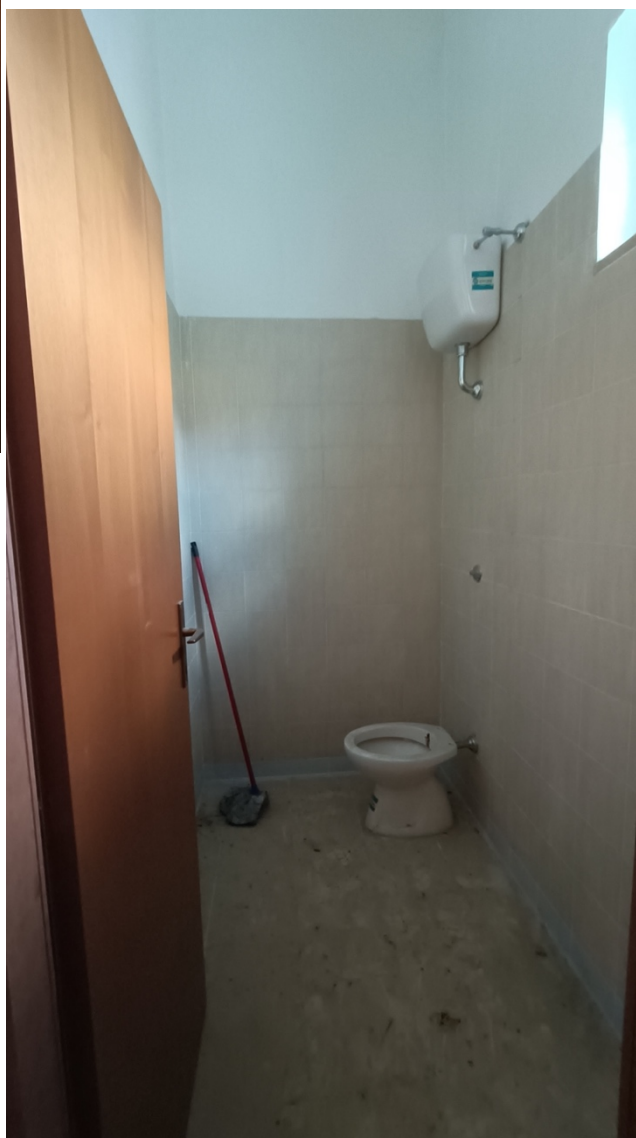
Negozio sito in Pescara alla Via di Sotto n.18, Piano terra, Scala B distinto al Foglio n.11 Particella n.1936 Sub. n.13