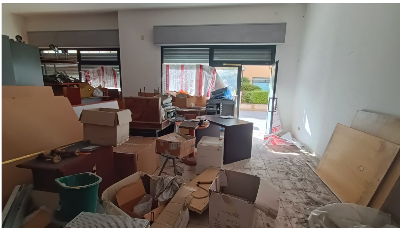
Negozio sito in Pescara alla Via di Sotto n.18, Piano terra, Scala B distinto al Foglio n.11 Particella n.1936 Sub. n.13