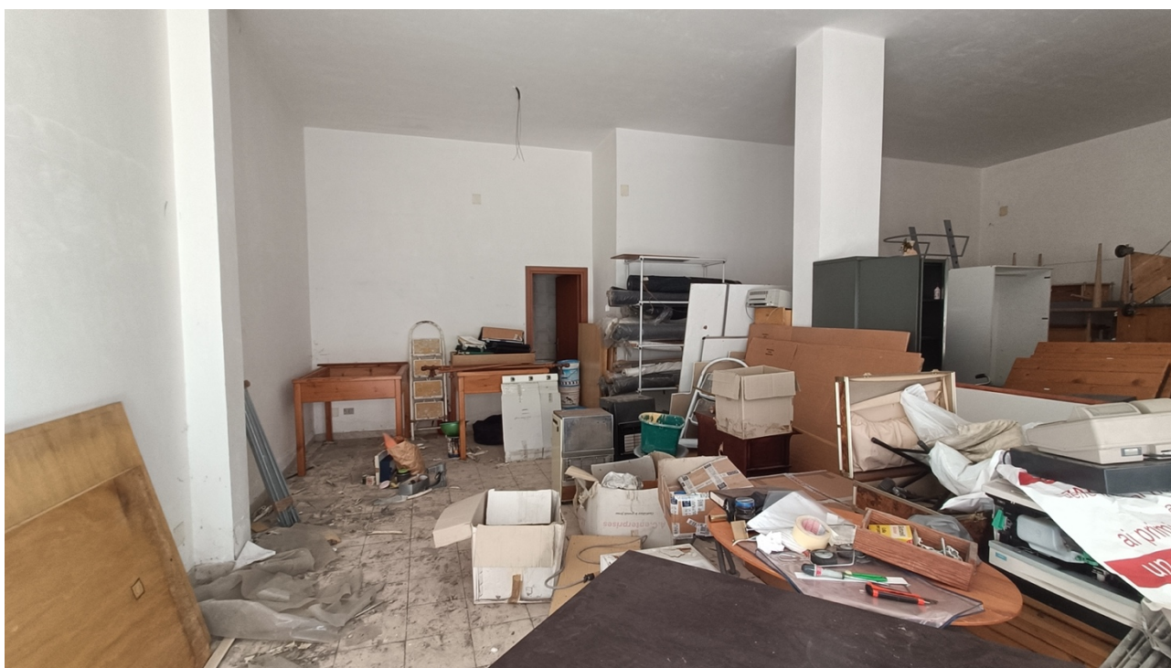
Negozio sito in Pescara alla Via di Sotto n.18, Piano terra, Scala B distinto al Foglio n.11 Particella n.1936 Sub. n.13